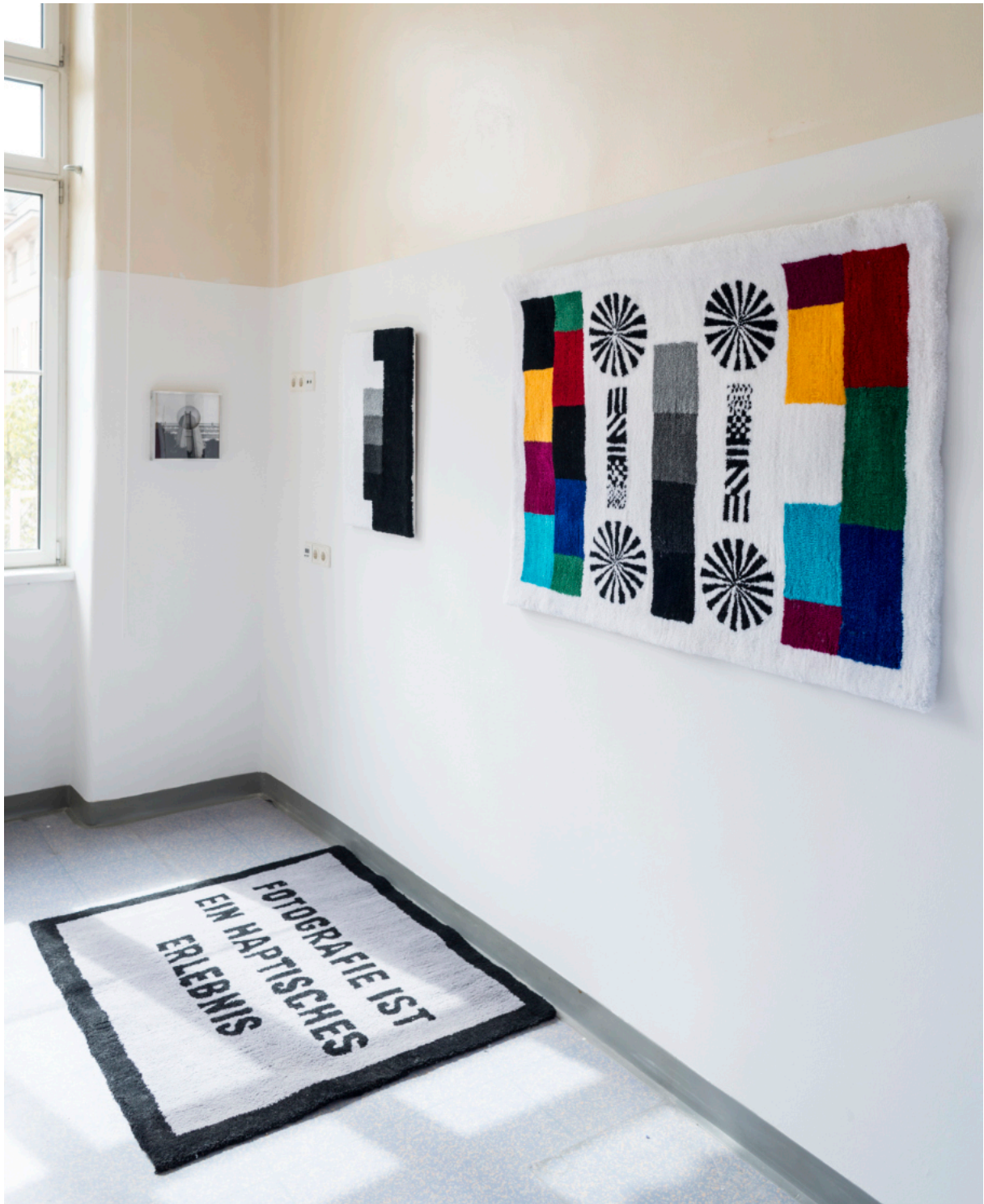
Ausstellungsansicht: Parallel Vienna, 2022 Fotogalerie Wien