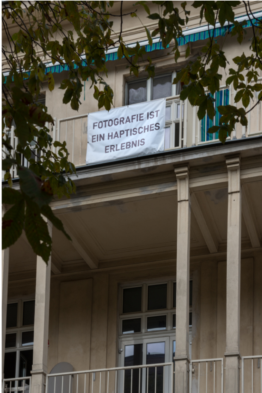
Ausstellungsansicht: Parallel Vienna, 2022 Fotogalerie Wien