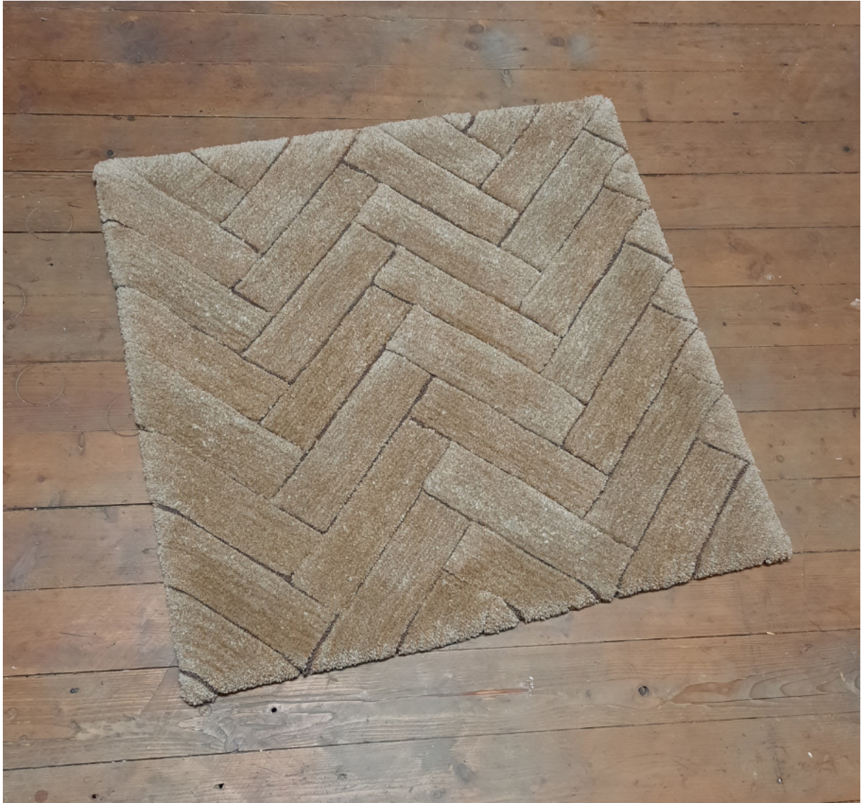
Fischgrätteppich aus der Serie „Fotografie ist ein haptisches Erlebnis“ 2023 handgetuftet, Baumwolle, Acrylwohle ca. 85 x 85