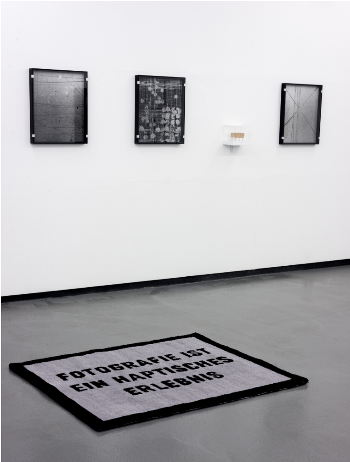
Ausstellungsansicht: Solo XIII Bastian Schwind „a scratch on the surface“ 2022 Fotogalerie Wien