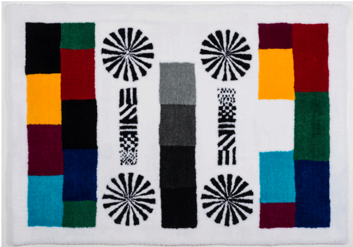
Testbildteppich 2022 Aus der Serie „Fotografie ist ein haptisches Erlebnis“ handgetufteter Teppich, Acrylwolle, Baumwolle ca.97 x 135 cm Unikat Fotosammlung des Bundes (BMKÖS)