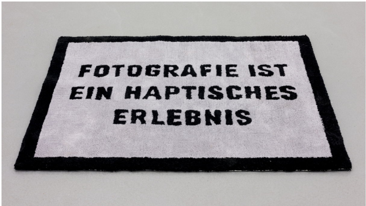
FOTOGRAFIE IST EIN HAPTISCHES ERLEBNIS 2022 Aus der Serie „Fotografie ist ein haptisches Erlebnis“ handgetufteter Teppich, Wolle, Baumwolle 111 x 134 cm Unikat