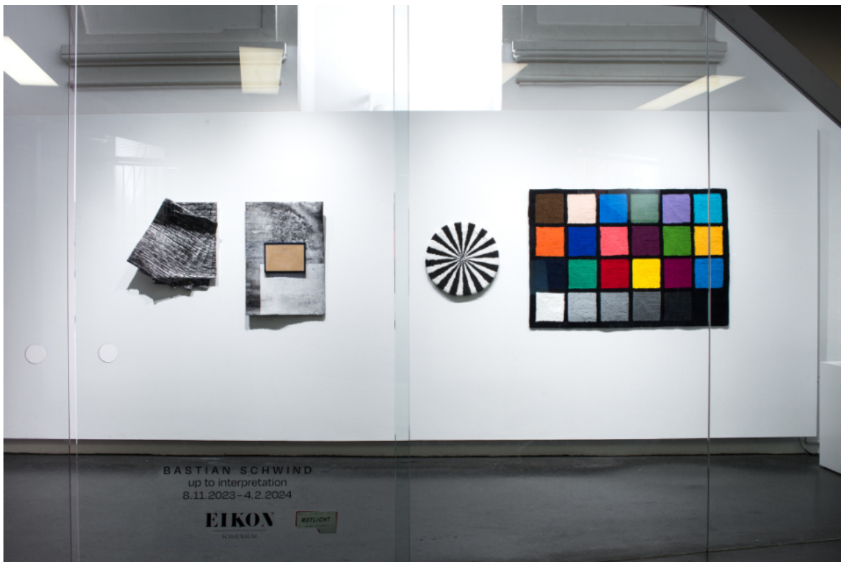
Ausstellungsansicht: up to interpretation, 2023 EIKON Schauraum, Museumsquartier Wien